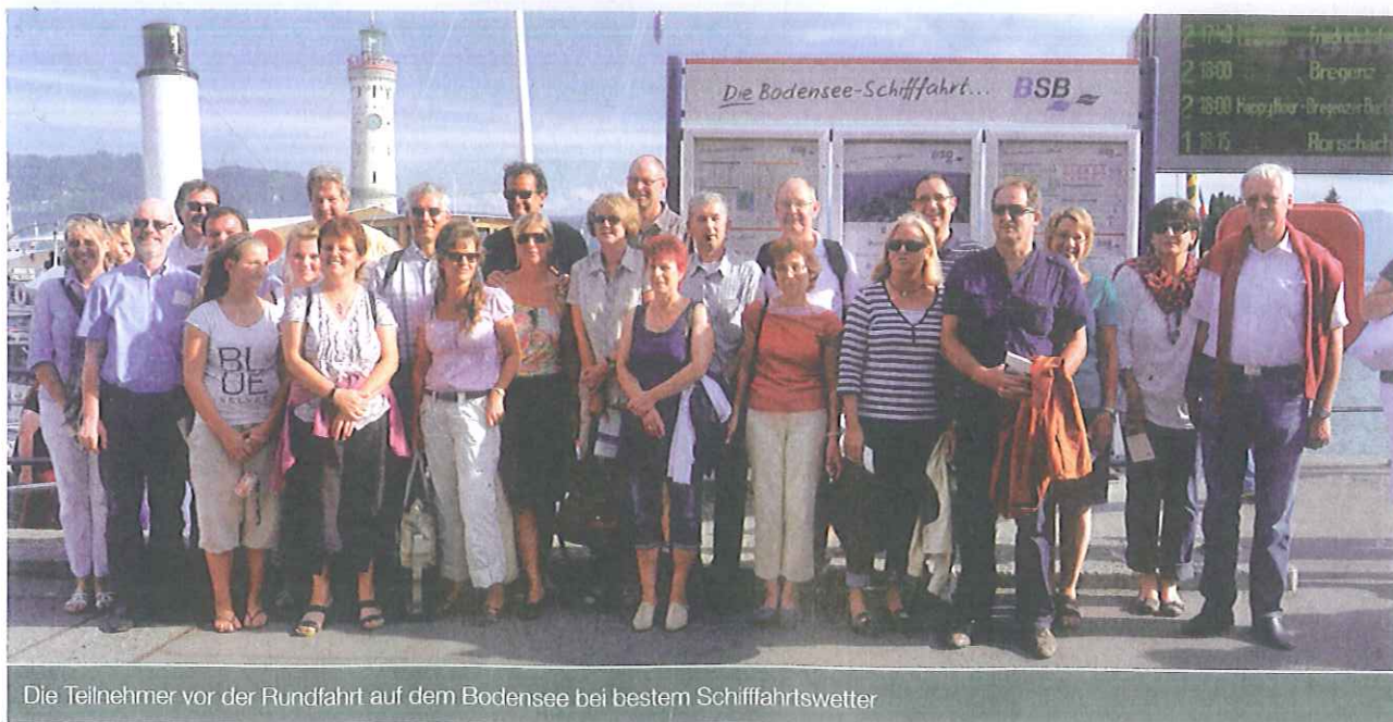
Die Teilnehmer vor der Rundfahrt auf dem Bodensee bei bestem Schifffahrtswetter